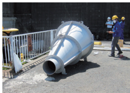
ボルテックスバルブ (装置外景)