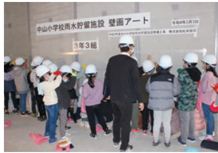
(施工後) 絵描き状況