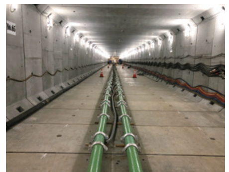
施工後、ボックスカルバート内