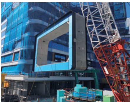
ボックスカルバートを揚重作業中